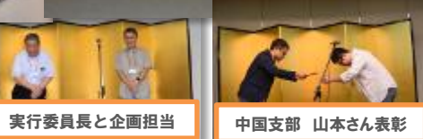
実行委員長と企画担当